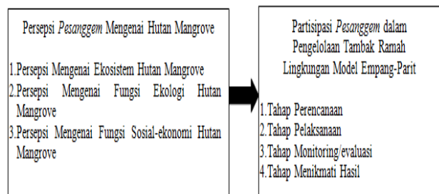
Gambar 1. Kerangka Pemikiran