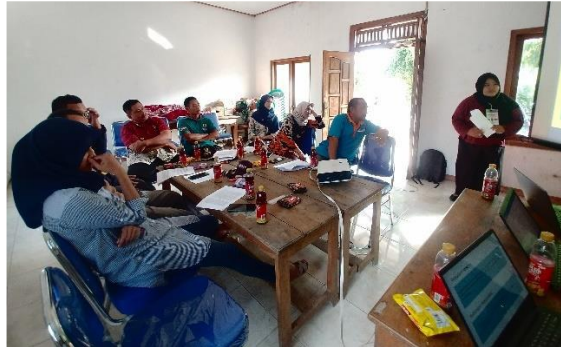
Gambar 7. FGD pembahasan rencana pembangunan Pasar Kuliner Digdaya

mengunjungi Pongol Island, membuka lapangan kerja dan mampu meningkatkan pendapatan ekonomi masyarakat Desa Simo. Upaya keberlanjutan Pasar Kuliner Digdaya yaitu dengan melakukan pendampingan kepada pelaku UMKM pengisi lapak, peningkatan sumber daya manusia (SDM) dan manajerial pengelola wisata, membuat konsep yang menarik setiap pasar beroperasi, dan peningkatan promosi serta branding wisata.