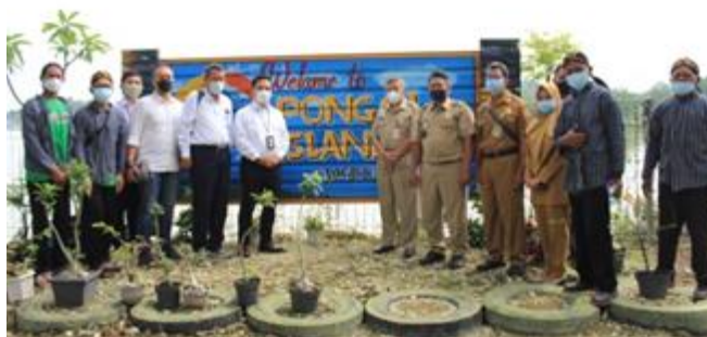
Gambar 3. Kunjungan tim Pertamina Foundation ke Pongol Island Waduk Simo