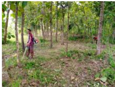
Gambar 9. Pembersihan lahan Pasar Kuliner Digdaya