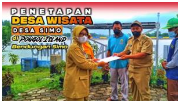
Gambar 6. Penyerahan surat keputusan penetapan Desa Simo menjadi desa wisata oleh Dinas Pariwisata Kabupaten Grobogan