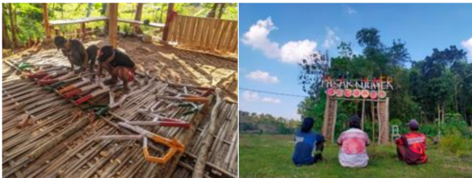
Gambar 8. Pembuatan gapura pintu masuk