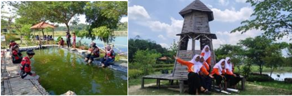
Gambar 4. Wahana Pongol Island Waduk Simo