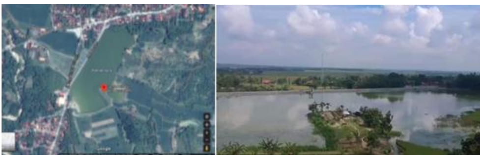
Gambar 1. Lokasi kegiatan (Pulau Pongol Waduk Simo)

Lokasi Pasar Kuliner Digdaya berada di bawah hutan jati kawasan Waduk Simo dan objek wisata Pongol Island. Alat yang digunakan yaitu alat-alat pertukangan dan alat-alat kebersihan. Bahan yang digunakan terbuat dari kayu untuk pembuatan lapak pedagang, pembuatan gapura, pembuatan meja kursi pengunjung, dan limbah kayu untuk pembuatan koin digdaya.