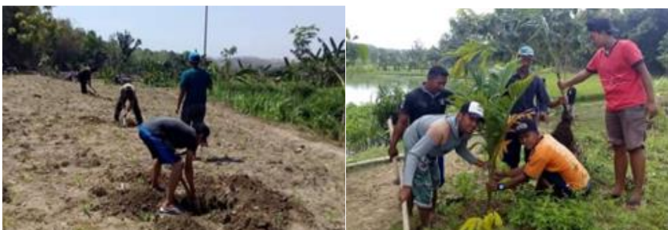
Gambar 2. Penanaman pohon di Pulau Pongol

Pongol Island Waduk Simo sebagai objek wisata rintisan memiliki beberapa kendala yaitu bidang infrastruktur dan sarana prasarana yang masih perlu ditingkatkan dari segi kuantitas maupun kualitas, sangat bergantung terhadap kondisi cuaca karena merupakan objek wisata alam, dan media promosi belum berjalan secara maksimal ditunjukkan dengan mayoritas pengunjung berasal dari masyarakat sekitar. Upaya keberlanjutan program yang akan dilakukan yaitu peningkatan sarana prasarana wisata, peningkatan sumber daya manusia (SDM) pengelola wisata, pemberdayaan UMKM masyarakat lokal, dan peningkatan publikasi, media serta branding wisata.