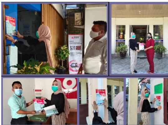
Gambar 1 Pemasangan poster di tempat-tempat umum

Kegiatan sosialisasi ini dilakukan dalam rangka untuk memberikan informasi kepada masyarakat kabupaten tentang Covid-19 baik berupa deskripsi singkat, bahaya yang dapat ditimbulkan, manifestasi klinis, cara penyebaran virus, dan cara pencegahan virus. Selain itu informasi juga mencantumkan langkah-langkah mencuci tangan dengan baik dan benar. Informasi ini diberikan melalui media poster dan spanduk yang diletakkan atau ditempelkan di tempat-tempat umum yang dapat dibaca oleh masyarakat secara langsung. Poster dan spanduk ini disajikan untuk meningkatkan kesadaran diri masyarakat dalam menjaga kebersihan tangan, dan meningkatkan pengetahuan tentang cara mencegah penularan penyakit.