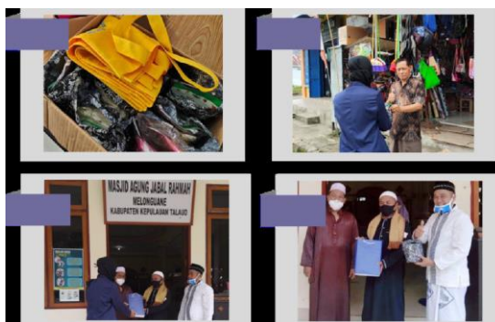
Gambar 3 Pembagian hand soap ke tempat umum dan tempat ibadah

Kegiatan lain yang dilakukan yaitu penyuluhan di gereja dalam upaya mendukung himbauan pemerintah yang saat itu menyarankan penggunaan masker kain untuk mencegah penyebaran Covid-19. Program diakhiri dengan pembagian masker, hand sanitizer , dan hand soap untuk meningkatkan kesadaran masyarakat akan pentingnya menjalankan protokol kesehatan seperti memakai masker saat pandemi Covid-19 yang penularannya sangat cepat, sehingga memunculkan inisiatif meminimalisir penularan Covid-19 dengan program ini.