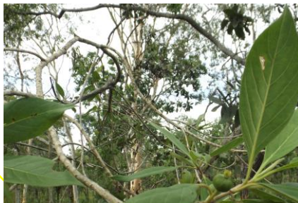
Gambar 3 Buah timon/ Timonius timon (Spreng.) Merr.