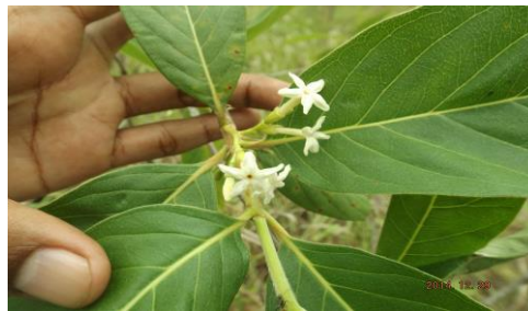
Gambar 4 Bunga timon/ Timonius timon (Spreng.) Merr.