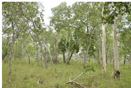
Gambar 6 Habitat timon/ Timonius timon (Spreng.) Merr. pada hutan jarang Melaleuca