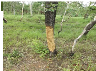
Gambar 5 Batang timon/ Timonius timon (Spreng.) Merr. dan kulit batang yang diambil sebagai bahan pengganti pinang