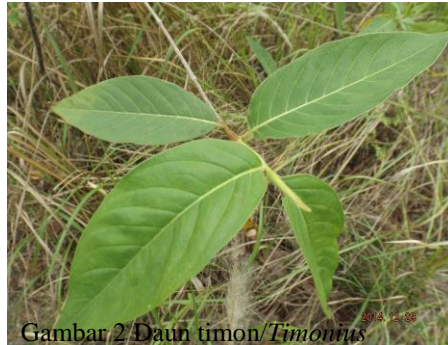
Gambar 2 Daun timon/ Timonius timon (Spreng.) Merr.