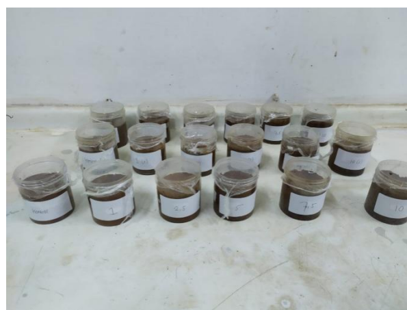
Gambar 3. Botol-botol plastik percobaan diinkubasi selama 14 hari

Setelah pengisian campuran tanah dan pupuk kalium silikat dalam botol tersebut selesai, maka perlahan-lahan campuran tersebut diberi akuades hingga mencapai kapasitas lapang. Botol plastik tersebut diinkubasi selama 14 hari (Gambar 3). Kadar air tanah kapasitas lapang percobaan dipertahankan melalui penambahan akuades yang jumlahnya didapatkan dari kehilangan bobot air selama masa inkubasi.