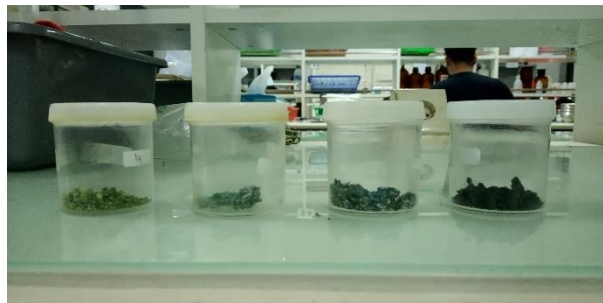
Gambar 1. Hasil pembuatan pupuk kalium silikat dalam bentuk padat

Pasir kuarsa yang telah bersih dan kering, dan KOH ditimbang masing-masing 26.8 g dan 50.0 g, dimasukkan ke dalam wadah besi, dan diaduk hingga homogen. Selanjutnya wadah besi yang berisi pasir kuarsa dan KOH dimasukkan kedalam tanur. Wadah besi yang berisi pasir kuarsa dan KOH tersebut dipanaskan pada suhu yang ditetapkan sebagai perlakuan. Suhu tersebut adalah 700 °C, 800 °C, 900 °C, dan 1000 °C. Pemanasan dilakukan secara perlahan-lahan sampai suhu mencapai suhu yang ditentukan. Setelah suhu yang ditentukan tercapai, tanur dimatikan dan wadah besi tersebut didiamkan di dalam tanur sampai dingin. Sampel pupuk kalium silikat yang dihasilkan dipindahkan dengan sendok ke dalam plastik klip lalu dipindahkan kedalam botol plastik (Gambar 1).