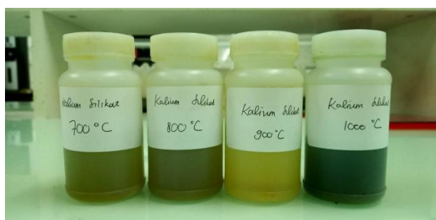
Gambar 2. Hasil sampel larutan pupuk kalium silikat

Setelah 30 menit pengocokan, botol kocok tersebut diangkat dari shaker , kemudian dидiamkan selama 30 menit untuk mengendapkan bahan-bahan yang tidak larut. Setelah itu larutan kalium silikat dalam botol kocok tersebut disaring dan ditempatkan di dalam botol (Gambar 2). Bahan-bahan yang tidak larut dipindahkan dengan akuades ke cawan porselin. Kemudian cawan tersebut dimasukkan kedalam oven diatur suhu 105 °C selama 24 jam. Hal ini dilakukan untuk mengeringkan bahan-bahan yang tidak larut tersebut. Bahan-bahan yang tidak larut tersebut turut diperhitungkan dalam menghitung kelarutan K dan Si. Kadar K larut ditetapkan menggunakan Flamephotometer dan Si larut ditetapkan menggunakan UV-VIS Spectrophotometer . Kemudian kadar K dinyatakan sebagai K 2 O dan Si dinyatakan sebagai SiO 2 .