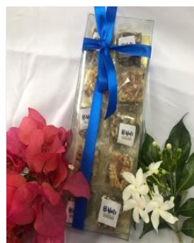
Gambar 1 Kemasan B'Nuts Snack Bar