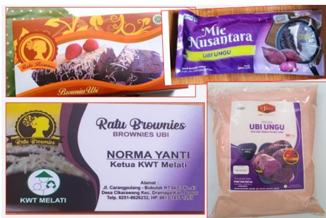
Gambar 4 Aneka produk olahan dari ubi ungu-Gapoktan Mandiri Jaya, Cikarawang

Pengemasan produk olahan ubi-ubian di Gapoktan Mandiri Jaya sudah dilakukan dengan kualitas kemasan yang cukup baik. Kemasan yang digunakan setiap produknya berbeda-beda. Produk tepung dikemas dalam plastik khusus kedap udara, sedangkan produk brownies ubi dikemas dalam box khusus berbentuk persegi panjang dan untuk produk minuman sari ubi ungu menggunakan botol plastik yang ditutup rapat sehingga udara luar tidak masuk. Kemasan produk olahan umbi-umbian yang dikelola Gapoktan Mandiri Jaya ditunjukkan pada Gambar 4 berikut ini.