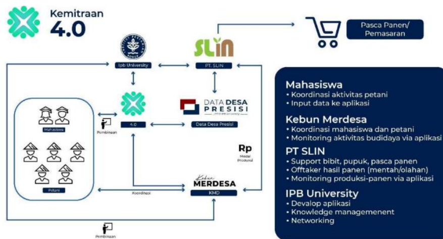
Gambar 1 Kerangka kerja kemitraan 4.0 berbasis data desa presisi

Upaya Pemberdayaan Gapoktan dan petani di Desa Cikarawang yang dilakukan LPPM IPB melalui Program Wlramuda, dengan menempatkan mahasiswa mahasiswa yang ber-KKNT IPB, IPB juga menginisiasi terbentuknya kemitraan dengan menjalin kolaborasi antar para pihak ( stakeholders ). Gapoktan dan petani lingkaran kampus IPB melalui diberdayakan agar mandiri dan memiliki bargaining position yang kuat dalam agrinisnis dan terlepas dari ketergantungan kepada tengkulak hasil bumi, dengan iptek yang kontemporer melalui penerapan kemitraan 4.0. Inovasi Kemitraan 4.0 berbasis Data Desa Presisi (DDP) sebagai pendekatan dalam menjawab kebutuhan pembangunan pertanian di Indonesia. Pendekatan ini mengakomodasi berbagai pemangku kepentingan, yaitu petani, perusahaan ( supplier saprotan dan oftaker ) dan perguruan tinggi dalam mencanangkan pembangunan pertanian berkelanjutan (Gambar 1).