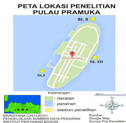
Gambar 1 Lokasi pengambilan sampel.

Daun lamun untuk analisis dibersihkan dari pasir dan kotoran-kotoran yang menempel menggunakan air laut, kemudian dicuci menggunakan air tawar untuk menghilangkan garam-garam yang masih menempel pada daun lamun. Sampel daun lamun yang telah dibersihkan dikeringkan