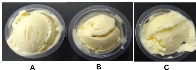
Gambar 1. Hasil produk es krim keju cream cheese 9% (A), camembert 11% (B), dan ricotta 9% (C)

Selain itu juga dilakukan uji ranking hedonik pada ketiga formula terbaik dari masing-masing persentase penambahan keju. Berdasarkan nilai rating hedonik, es krim keju cream cheese 9% merupakan es krim yang paling disukai oleh panelis dari segi rasa, aroma, dan warna (Gambar 1 dan 2).