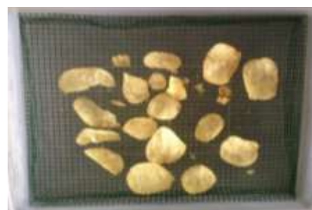
Gambar 1. Wadah penyimpanan tertutup yang digunakan dalam penelitian

Kadar air kritis ( m_c ) dengan menyimpan sampel selama 0, 30, 45, 60, 90, dan 120 menit tanpa kemasan pada wadah tertutup, dilengkapi penyangga dan diisi air 2 L (Gambar 1) agar penurunan kerenyahan lebih cepat (RH air 100% setara a_w = 1 ). Proses ini menghasilkan seri sampel dengan waktu penyimpanan berbeda, sampel dikemas kembali untuk uji organoleptik rating intensitas oleh delapan panelis dengan parameter kerenyahan.