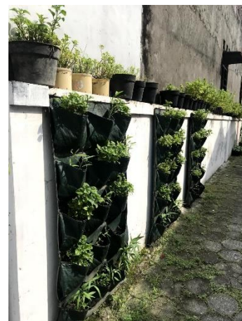
Gambar 4. Contoh infrastruktur hijau tipe koridor pada gang kampung di Kampung Bausasran

Berdasarkan Tabel 3, dominasi implementasi infrastruktur hijau di kampung kota memiliki pola spasial tersebar yang terletak di pekarangan dan bangunan milik warga, lahan khusus milik pemerintah, lahan desa, dan di sepanjang koridor jalan serta sempadan sungai. Pola spasial yang menyebar ini menandakan bahwa implementasi dari infrastruktur hijau di kampung kota sudah dilakukan oleh seluruh lapisan masyarakat setempat. Namun demikian, pengembangan infrastruktur hijau tipe koridor juga layak dipertimbangkan untuk dikembangkan di kampung yang padat dengan kondisi lahan terbuka yang terbatas. Meskipun dengan luasan yang terbatas, infrastruktur hijau tipe koridor juga berpotensi untuk diterapkan untuk beragam fungsi, mulai dari produksi pangan hingga penambah daya tarik visual permukiman (Gambar 4).