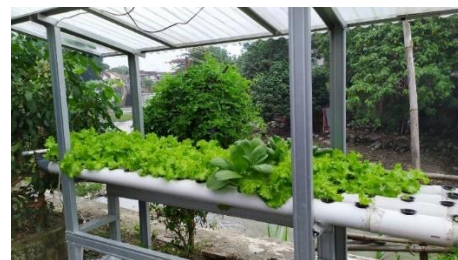
Gambar 2. Contoh infrastruktur hijau penunjang ketahanan pangan di Kampung Patangpuluhan

Tipologi aplikasi infrastruktur hijau menurut fungsinya ini seringkali tidak dapat dipisahkan secara eksklusif antara satu tipe dengan tipe lainnya. Misalnya, meskipun tujuan utamanya adalah untuk konservasi lingkungan, pada kenyataannya tanaman yang digunakan seringkali adalah tanaman pangan yang hasilnya dapat dikonsumsi oleh masyarakat setempat, yang kemudian ketika kebutuhan pangan telah terpenuhi, hasil tersebut dapat dijual ke daerah lain sebagai sumber penghasilan tambahan bagi masyarakat (Gambar 2 dan 3).