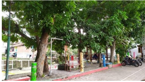
Gambar 3. Contoh infrastruktur hijau sarana sosialisasi di Kampung Patangpuluhan