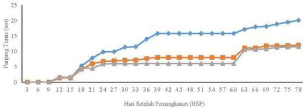
Gambar 1 Pengaruh perlakuan pemangkasan terhadap pertambahan panjang tunas jeruk keprok Borneo Prima. ◆ Kontrol, ■ Pangkas terbuka tengah, ▲ Pangkas pagar