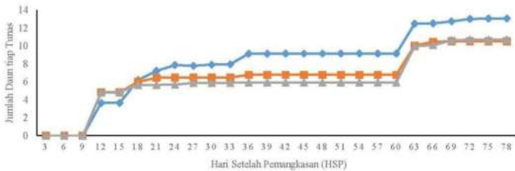
Gambar 2 Pengaruh perlakuan pemangkasan terhadap pertambahan jumlah daun tiap tunas jeruk keprok Borneo Prima. ◆ Kontrol, ■ Pangkas terbuka tengah, ▲ Pangkas pagar