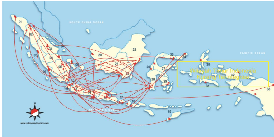
Gambar 3. Elastisitas Transmisi Harga Gula di 33 Provinsi di Indonesia

Jawa Timur merupakan provinsi gula terbesar di Indonesia dengan produksi gula 1,25 juta ton pada tahun 2013. Sebagai daerah acuan Jawa Timur hanya mempengaruhi pembentukan harga gula Kalimantan Selatan diperlihatkan dengan uji t-statistik b_2 yang menunjukkan kedua pasangan tersebut terintegrasi dalam jangka panjang. Sebagai daerah pengikut Jawa Timur terintegrasi dengan lima daerah acuan ditunjukkan dengan uji t-statistik b_2 yaitu Jawa Barat dengan nilai (1,601), Jawa Tengah (0,202), Sumatera Selatan (1,959), Lampung (0,955) dan Jakarta (1,529) atau signifikan pada taraf 5 persen. Sedangkan transmisi harga terlihat pada nilai b_2 yaitu sebesar Jawa Barat dengan nilai (0,82), Jawa Tengah (0,987), Sumatera Selatan (0,860), Lampung (0,895) dan Jakarta (0,980). Nilai b_2 Jawa Timur ini terlihat bahwa perubahan harga di di daerah acuan dapat ditransmisikan dengan baik, sehingga para produsen gula di Jawa Timur dapat menikmati perubahan harga di daerah konsumen gula.