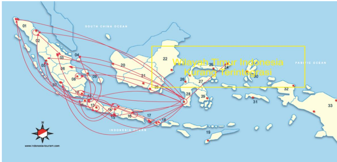
Gambar 2. Elastisitas Transmisi Harga Beras di 33 Provinsi di Indonesia

dapat diartikan bahwa apabila harga beras di Sulawesi Selatan naik sebesar 1 persen maka harga di Jawa Barat akan naik sebesar 0,924 persen dan Jawa tengah akan naik sebesar 0,736 persen.