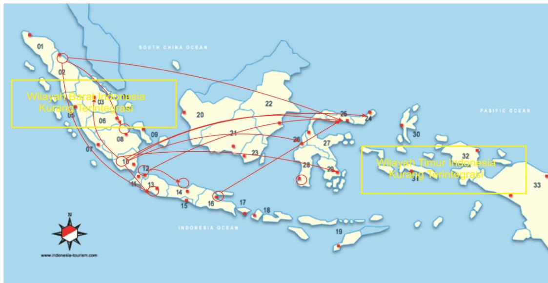
Gambar 4. Elastisitas Transmisi Harga Kedelai di 33 Provinsi di Indonesia

di Indonesia hanya terjadi di 11 provinsi di Indonesia, sedangkan 22 provinsi lainnya menunjukkan nilai uji t yang tidak signifikan dan tidak terintegrasi dengan daerah acuan yang diteliti.