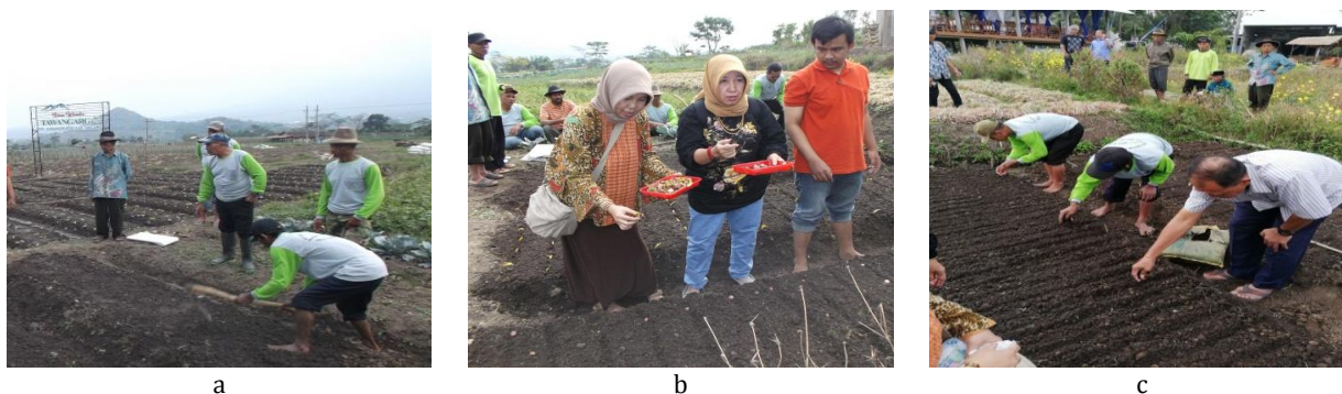
Gambar 2 a) Pembuatan larikan untuk penanaman umbi bawang merah; b) Penanaman bawang merah yang berasal dari umbi; dan c) Penanaman dari benih true seed of shallot .

Selama kegiatan berlangsung, tim pelaksana kegiatan pengabdian masyarakat memantau pertumbuhan dan perkembangan tanaman bawang merah untuk produksi TSS dan pembentukan umbi mini yang berasal dari TSS. Umbi yang ditanam sebanyak 25/m 2 , yang tumbuh dengan baik menjadi tanaman sekitar 99,31% (24 tanaman/m 2 ) untuk varietas Batu Ijo, sementara itu yang berasal dari TSS dapat