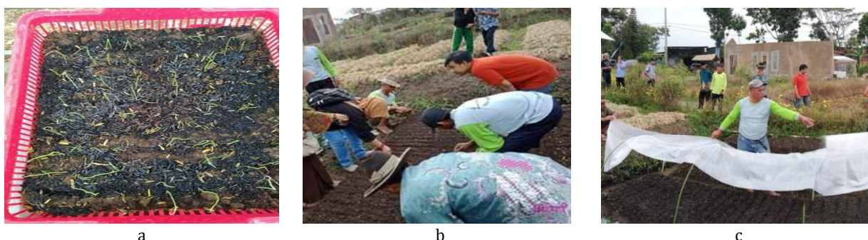
Gambar 3 a) Persemaian biji true seed of shallot dalam bak perkecambahan; b dan c) Persemaian langsung di lapang.