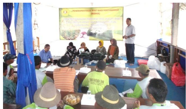
Gambar 1 Sosialisasi teknik memproduksi biji true seed of shallot umbi mini kepada kelompok tani Tani Mulya Desa Tawangargo.

Tim pengabdian masyarakat melakukan kegiatan sosialisasi tentang teknologi pembungaan bawang merah dan pembentukan biji TSS serta pembentukan umbi mini bawang merah kepada khalayak sasaran, yaitu kelompok tani “Tani Mulya” yang berada di Kecamatan Tawangargo, Kabupaten Malang, Provinsi Jawa Timur. Kurang lebih sebanyak 20 orang petani mengikuti kegiatan sosialisasi teknologi pembungaan bawang merah dan pembentukan umbi mini yang bertempat di gazebo dekat lahan petani Tani Mulya (Gambar 1). Petani dijelaskan teknik vernalisasi (disimpan pada suhu dingin 5–