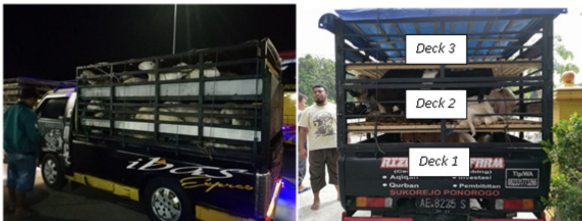
Gambar 1. Alat transportasi pick-up triple-deck

Dua mobil pick-up Mitsubishi L 300 dengan bak triple-deck berukuran panjang 218 cm, lebar 148 cm (kepadatan 0.158 \text{ m}^2 \text{ ekor}^{-1} ), dan tinggi tiap deck 40 cm digunakan untuk mengangkut ternak penelitian (Gambar 1). Ketinggian 40 cm didesain untuk ternak pada posisi berbaring selama dalam perjalanan, ini tidak sesuai dengan Peraturan nomor 114/Permentan/PD.410/9/2014 yang mensyaratkan kendaraan di desain agar ternak bisa berdiri. Ternak ditransportasikan dari daerah asal menuju RPH Kota Bogor secara beriringan. Rute perjalanan melewati jalur tol dan non tol. Jalur tol masuk melalui pintu tol Ngawi