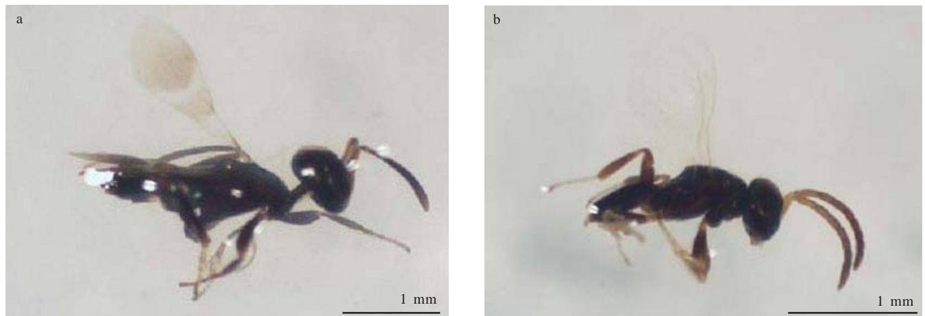
Gambar 2. Imago A. dasyni . a. betina dan b. jantan.