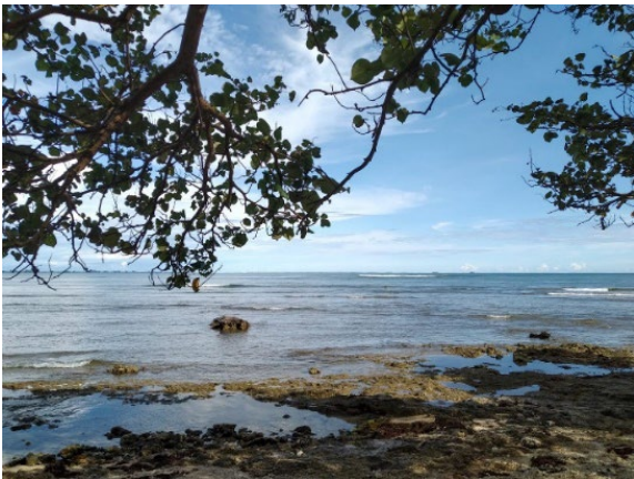
Gambar 1. Pesisir Pantai Lhok Bubon, Samatiga, Aceh Barat

Penelitian dilakukan pada bulan Mei 2022 di daerah intertidal Pesisir Lhok Bubon, Samatiga, Aceh Barat (titik koordinat GL 4,1946299 dan GB 96,0257195). Karakteristik pesisir pantai Lhok Bubon memiliki panjang sekitar 2-3 km dengan tingkat kedalaman yang bervariasi. Tipe substrat lokasi penelitian pasir berbatu dan ditemukan dengan keberadaan pecahan karang.