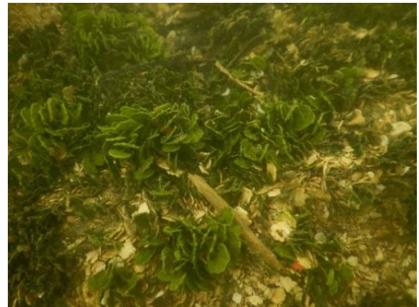
Gambar 2. Makroalga di Pantai Lhok Bubon.

Pada lokasi penelitian, Halimeda ditemukan pada substrat yang memiliki karakteristik berpasir yang bercampur dengan pecahan terumbu karang ( rubble ) dan terumbu karang. Hamparan makroalga yang ditemukan di pantai Lhok Bubon disajikan pada Gambar 2. Berdasarkan hasil identifikasi secara morfologi, ditemukan 4 jenis Halimeda di lokasi penelitian. Genus Halimeda yang ditemukan adalah H. macroloba , H. macrophysa , H. incrassata , Halimeda simulans , (Gambar 3 a,b,c, dan d).