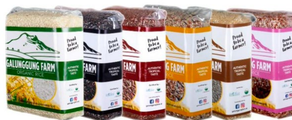
Gambar 2. Produk Beras Organik Galunggung Farm

Galunggung Farm memiliki 6 varian produk beras organik. Ke-enam varian tersebut memiliki keunggulan dan manfaat masing-masing. Produk ini memiliki 2 jenis kemasan yang dijual berdasarkan berat, yaitu kemasan 1 kilogram dan 5 kilogram. Beras Organik Galunggung Farm sudah tersertifikasi oleh lembaga organik indonesia (INOFICE) dan terbukti tidak mengandung GMO ( Genetically Modified Organism ). Selain itu, produk beras Galunggung Farm sudah memiliki izin edar dari Dinas Ketahanan Pangan provinsi Jawa Barat. Setiap varian beras menggunakan kemasan yang berbeda-beda sesuai dengan variannya, sehingga memberikan kemudahan konsumen dalam memilih dan membedakan antara varian produk.