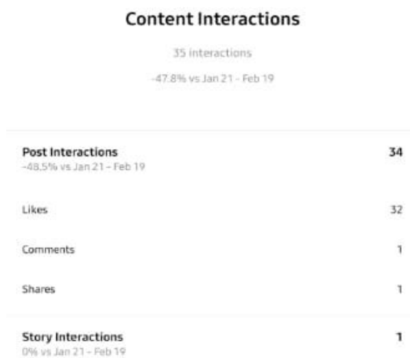
Gambar 3. Interaksi Konten Galunggung Farm

Tahap ini bertujuan untuk membuat konsumen bertindak yang dapat membuat pengunjung mengetahui produk yang dimiliki. Hal yang dilakukan adalah menarik pengunjung agar berkunjung ke media sosial dan menciptakan interaksi dengan pengunjung. Berikut keadaan pemasaran media sosial berdasarkan dengan indikator interaksi konten pada Instagram @Galunggungfarm.id