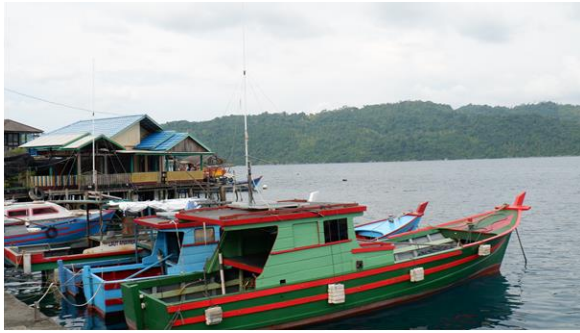
Gambar 2. Perahu pompong di Piasan, Palmatak