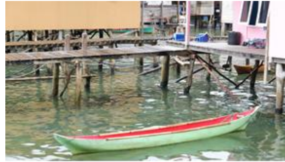
Gambar 3. Perahu jongkong di Air Bini, Siantan Selatan

Berdasarkan data yang diperoleh, sebagian besar nelayan Kabupaten Anambas masih menggunakan pompong dengan ukuran 1 GT dan jongkong (lihat Tabel 1). Dari lima kecamatan di Kepulauan Anambas, nelayan Kecamatan Palmatak merupakan wilayah yang paling banyak menggunakan jongkong dan pompong berukuran 1 GT.