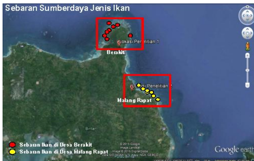
Gambar 2. Peta Sebaran Sumberdaya Jenis Ikan yang Tertangkap oleh Nelayan

Menurut pendapat Koesoebiono (1995) dalam Widiastuti (2011) fungsi ekosistem lamun di lingkungan pesisir