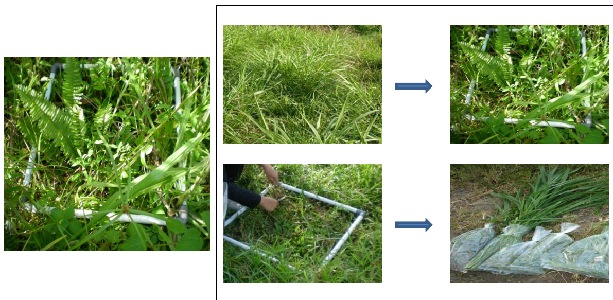
Kuadran ( Plate mater )

Produksi biomas dalam bahan kering diperoleh dengan mengalikan produksi biomas segardengan kandungan bahan kering. Kapasitas tampung dihitung menurut Reksohadiprodjo (1985) dan Damry (2009), dengan asumsi bahwa satu unit ternak (UT) setara dengan sapi dengan bobot 500 kg, dengan kebutuhan pakan ternak per hari (dalam bentuk bahan kering) ditetapkan sebesar 3% dari bobot badan. Kapasitas tampung dihitung dengan membagi produksi biomas per hari dalam bentuk bahan kering per hari (kg) dengan kebutuhan bahan kering per hari, yaitu sebesar 15 kg. Komposisi botanis dihitung dengan metode dry weigh rank (Susetyo, 1980).