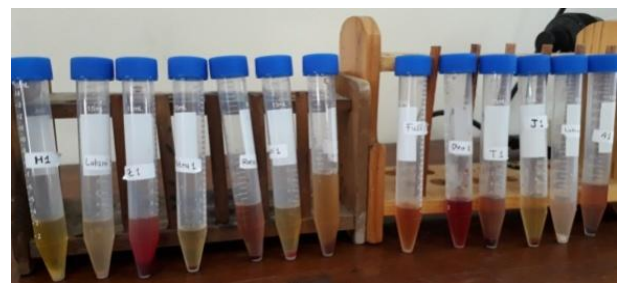
Gambar 1 Sampel urin kucing dengan gejala feline urologic syndrome (FUS) dari klinik hewan La Femur Surabaya.

Pemeriksaan metode dipstick dilakukan dengan meletakkan satu strip kertas dipstick di atas handuk atau tissue kertas bersih, lalu urin diteteskan pada setiap sisi test pad . Sedangkan pada pemeriksaan mikroskopik dilakukan dengan cara: urin sebanyak 2-3 ml disentrifugasi dengan kecepatan 3000 rpm selama 5 menit, kemudian endapan diambil untuk dilakukan pengamatan. Beberapa tetes endapan urin diteteskan pada objek glass dan ditutup dengan cover glass, setelah itu diamati dibawah mikroskop cahaya pada perbesaran 400 x.