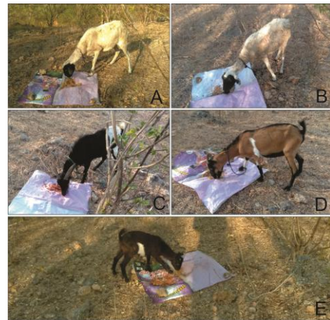
Gambar 2 Pengujian palatabilitas biskuit pakan berlimbuan antelmintika. (A, B) albendazole, (C, D) piperazine, (E) levamisole

dikeringkan selama dua hari setelah pembuatan dimakan hingga habis oleh kambing dan domba (Gambar 2) dalam durasi yang hampir sama sekitar 20 hingga 30 detik.