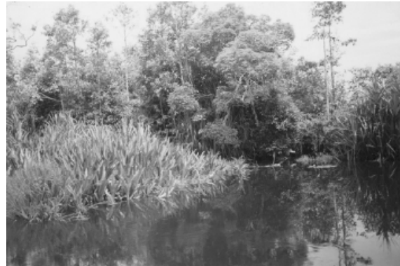
a. Pasunde Kabupaten Musi banyuasin

Pengumpulan data ikan bujuk ( Channa cyanospilos ) dilakukan secara survey sebanyak 3 kali dalam 1 tahun pada bulan Mei, Juni dan September 2004 di stasiun pengamatan di Sungai Kakap, Arisan Belido Muara Enim, Pasunde dan Semeler Musi Banyuasin yang ditentukan berdasarkan kondisi lokasi penelitian yang merupakan sentra produksi ikan gabus. Enumerator dan observer dilibatkan dalam pengumpulan data lapangan. Parameter yang diamati antara lain: distribusi frekuensi panjang total, hubungan panjang - berat, hubungan fekunditas dengan panjang total dan berat ikan, Tingkat Kematangan Gonad (TKG), Indeks Kematangan Gonad (IKG), fekunditas, pakan alami dan habitat/lingkungan. Alat tangkap yang digunakan dalam penelitian ini adalah pancing/tajur ( hook line ) dengan ukuran mata pancing 5-8, pengilar ( pot traps ) dan penangkapan sistem ngesar ( active seine ) dapat tertangkap semua ukuran.