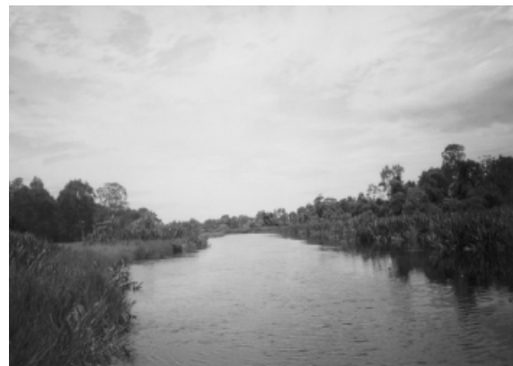
b. Arisan Belido Kabupaten Muara Enim