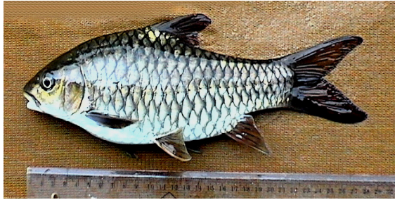
Gambar 1. Ikan Batak ( Tor soro ) dari Populasi Aek Sirambe

rutung), Kabupaten Toba Samosir (Sungai Aek Sirambe) dan Kabupaten Sumedang. Jumlah contoh per populasi yang digunakan untuk pengamatan DNA adalah 15 ekor. Peralatan yang digunakan meliputi PCR, sentrifuse, vortex, mikropipet, tip, tube, UV transilluminator, film polaroid, heater, dan kotak elektroforesis.